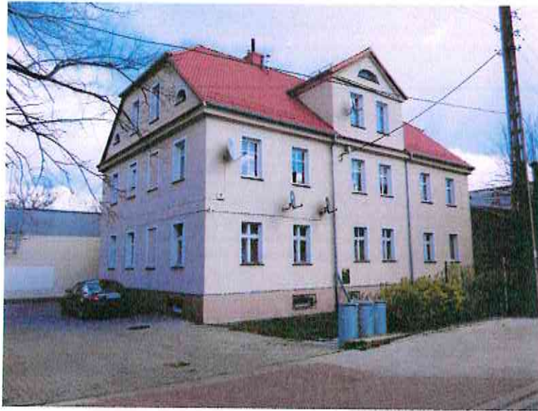
Bielawa, ul. Bohaterów Getta 7/1A